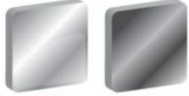
Metalik Gri Ral 9006